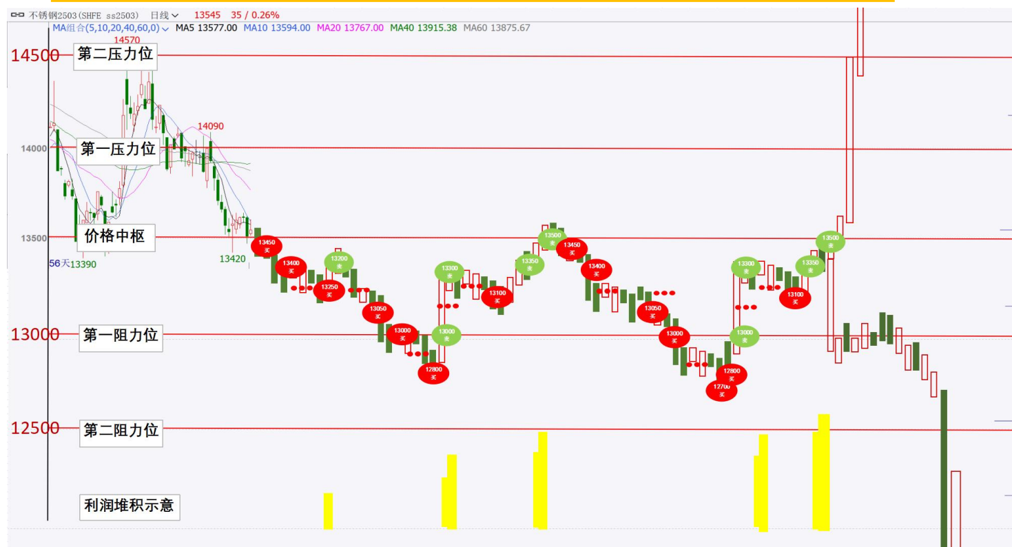
图 1：网格策略示意图

第一步： 不锈钢震荡区间设置网格，确定网格策略中各要素(具体见下图)，中轴位置附近建初始底仓约 100 手。