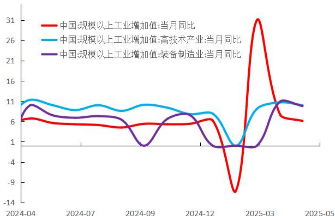
图 2：新质生产力引领工业增长加快（%）