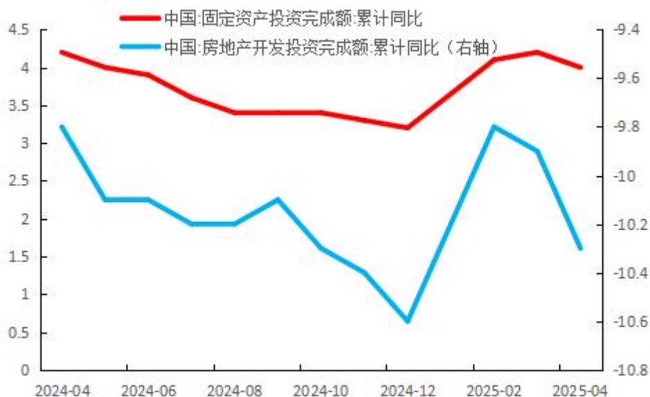
图 4：固定资产投资持续扩大