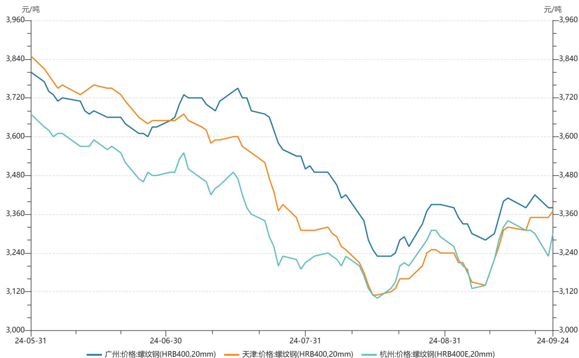
主要城市钢铁价格:棒材和线材(日)

9 月份，螺纹价格创新低，价格走势整体以底部摸底，区间震荡走势为主，主要矛盾还是市场以价换量，以消化旧标库存为主。今日受央行降准信息和存量房贷利率下调言论影响，早盘黑色拉升，宏观转暖，螺纹收盘价格突破并站上 9 月以来的收盘价震荡区间。