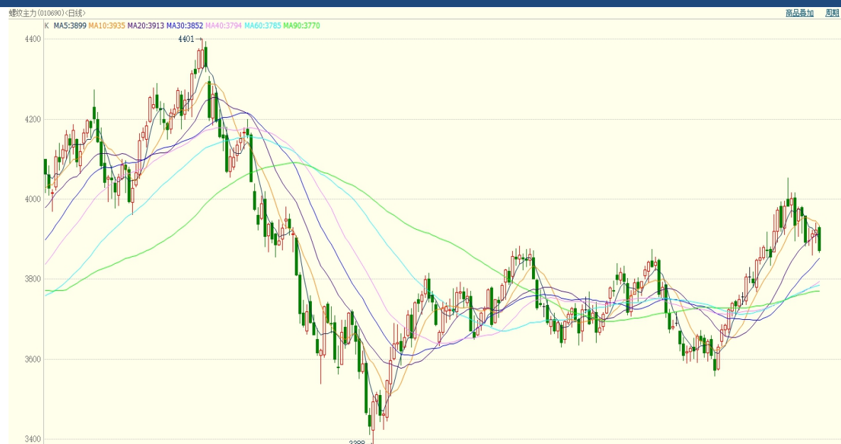
图1：2023年截至12月4日螺纹钢期货主力合约日K线走势图：元/吨