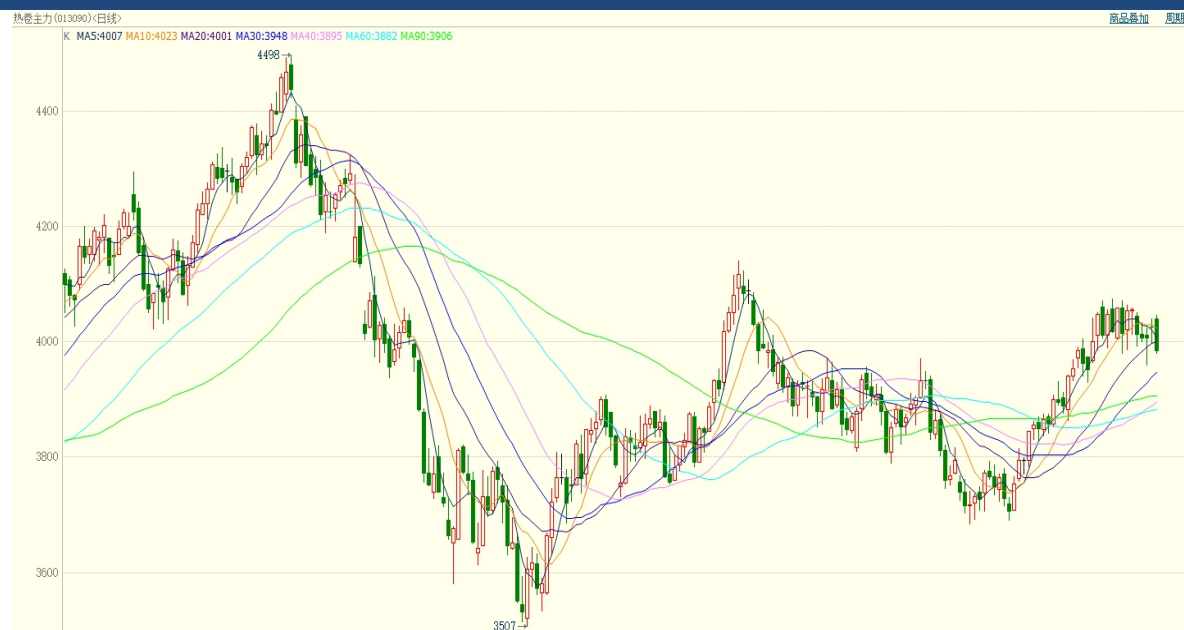
图2：2023年截至12月4日热卷期货主力合约日K线走势图：元/吨