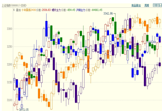
图3：一季度国内股市、债市、普通金属价格走势：

伴随着 2022 年 11-12 月份疫情防控政策的逐步放开，不论是中国股市、债市还是普通金属市场，在 2023 年一季度大都迎来了经济预期向好带动的上涨行情。