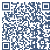
南华期货营业网点

公司总部地址：浙江省杭州市上城区富春路 136 号横店大厦 邮编：310008 全国统一客服热线：400 8888 910 网址： www.nanhua.net 股票简称：南华期货 股票代码：603093