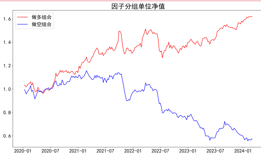
图表 1：因子分组单位净值