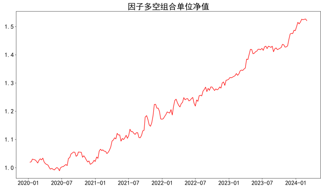
图表 2：因子多空组合回测净值表现