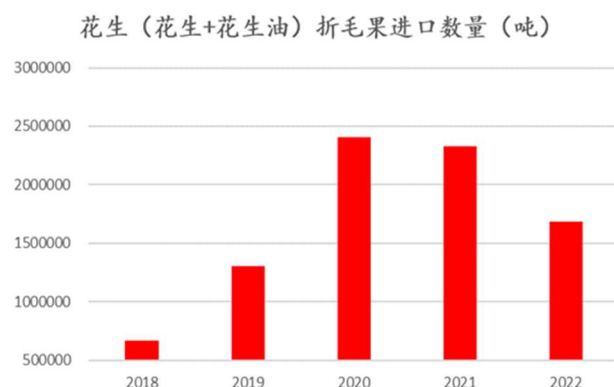
图：花生折毛果进口数量