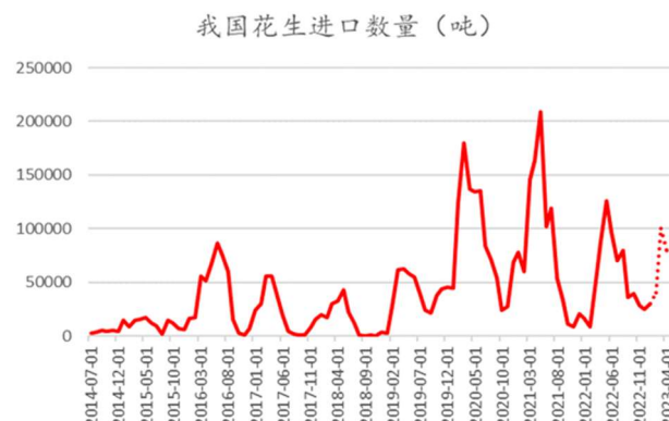
图：我国花生进口数量