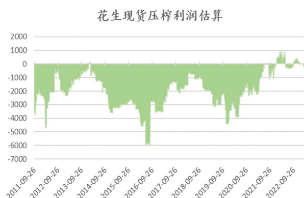
图：花生现货压榨利润