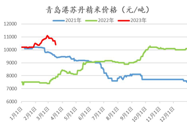
图：青岛港苏丹精米价格

春节后花生期货与现货价格螺旋式上行，新仓单成本价格高企抑制新仓单的生成。苏丹精米价格从年后 10400 元/吨上涨至最高点 11100 元/吨，跟随盘面大幅上行。进口米价格较高抑制新仓单生成，3 月仓单数最高仅有 372 张。直接采购当前现货生成仓单并不具备无风险套利空间。