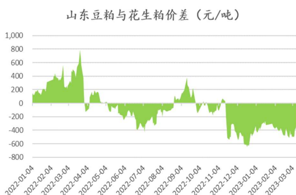
图：山东豆粕与花生粕价差