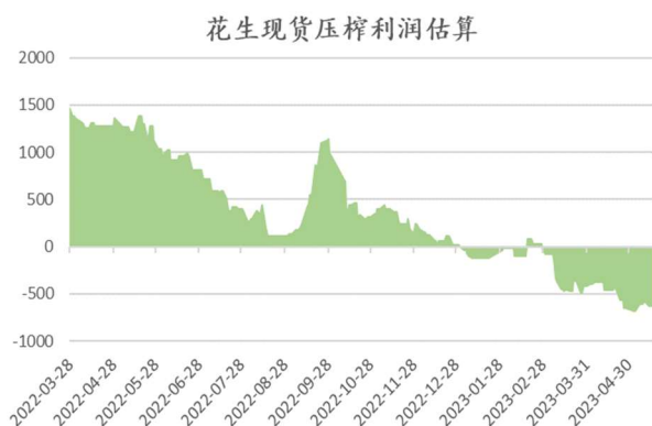
图：花生现货压榨利润估算