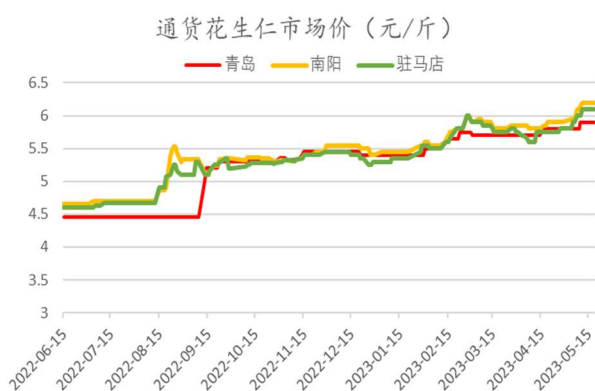
图：通货花生市场价格

北方港口苏丹精米维持高价，在 3 月花生 19 万吨的进口量之后，花生进口数量逐步递减。进口米大部分已锁定下游，部分进口商盘面高价套盘意愿较强。