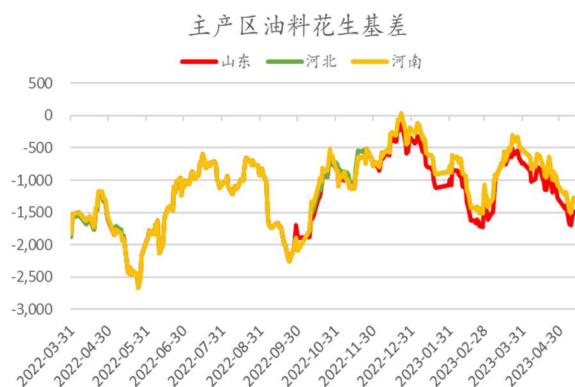
图：主产区油料花生基差