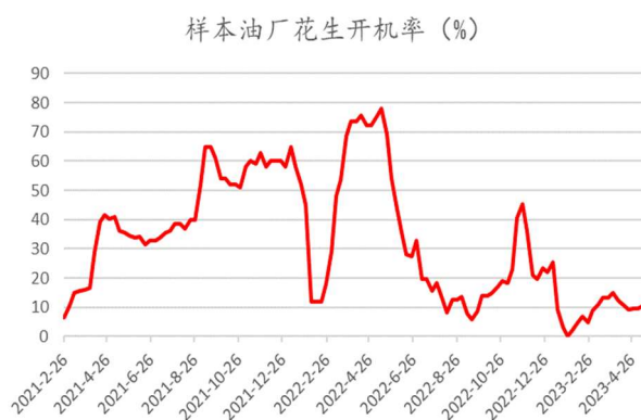
图：样本油厂花生开机率