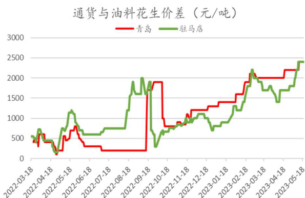
图：通货与油料价差

花生 10 合约盘面近 2 周从高位整体回落，油厂到货油料米价格相对平稳，主产区花生基差有所回升。需要注意当前油厂到货的低价油料米品质较差，不符合交割标准，无法用当前油料米价格实现 10 合约无风险套利。