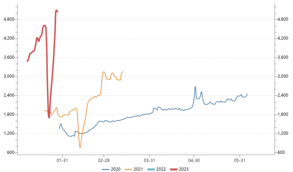
图 1：全国春运日客运量

春节期间的出行数据，显示社会活动热度增强，同时，酒店预订量超过 2019 年春节，显示出游消费复苏较好。此外电影票房等消费活动有着不同程度修复，反映了经济活动中的消费整体上是复苏的状态中。