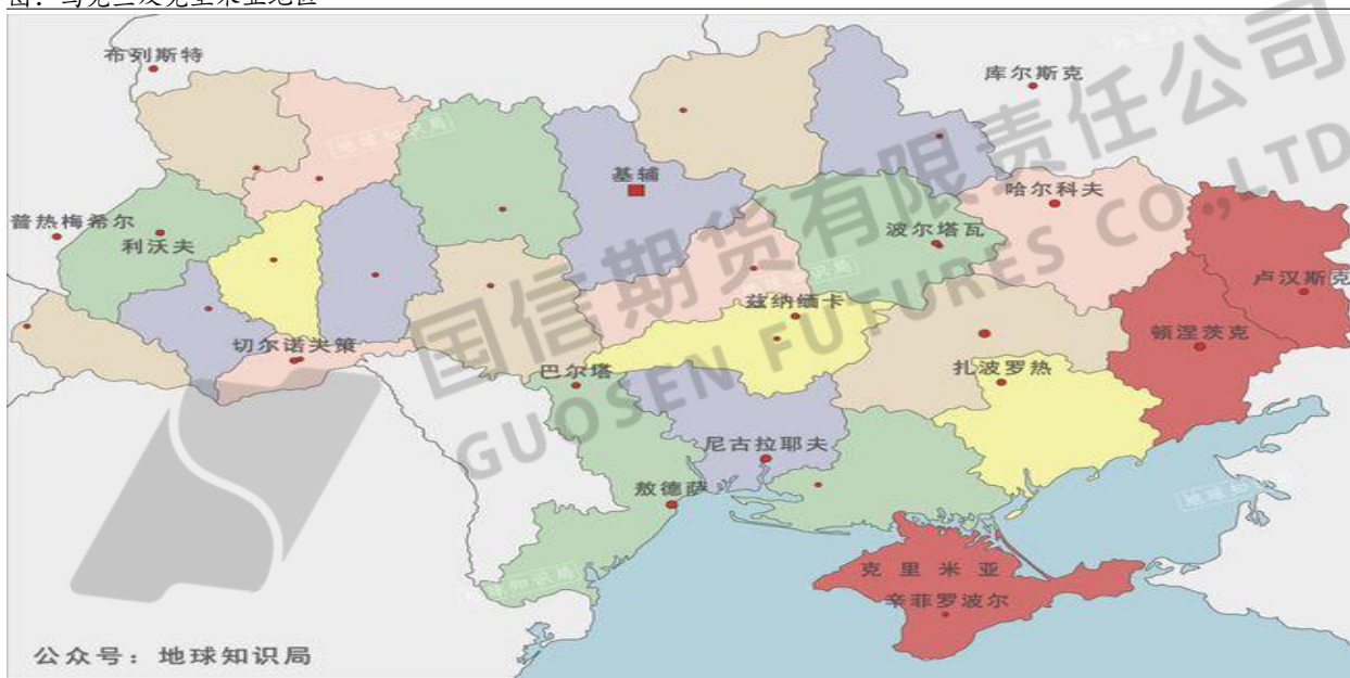
图：乌克兰及克里米亚地区

2014 年克里米亚宣布独立，其中原因是由于克里米亚地区俄罗斯族人口占了主体，克里米亚地理位置对于俄罗斯来说极其重要，在俄罗斯支持下，克里米亚地区从乌克兰独立出去。