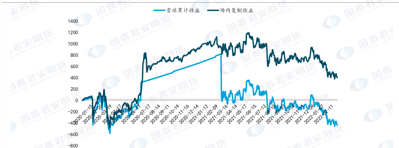
图 5：期权+期货动态组合复刻雪球结构表现

为了更加贴近雪球产品在敲入后跟踪标的走势的收益特点，我们在敲入水平线位置平仓期权头寸换成期货多头头寸，最终表现与雪球结构相似，为了直观展示雪球产品敲入敲出状态下的场内复制组合的收益对比，我们使用敲入线为 90%，年化票息为 15% 的雪球结构进行对比。对比图如下：