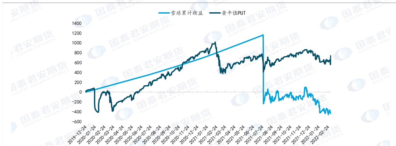
图 2：滚动卖出平值 PUT 对比雪球产品收益表现

对比雪球产品来说，卖出平值看跌期权在标的价格小幅下跌时产生的回撤较大。雪球产品的保护区间一般处于 10% 以上，但是当标的下跌近 10% 时，卖出平值看跌期权已经产生了较大亏损，累计收益表现明显弱于雪球产品。以敲入水平为 85%，票息为 15% 的雪球结构为例进行对比，对比图如下所示：