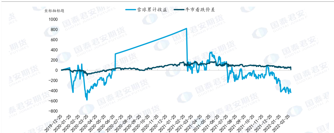
图 4：长期持有牛市看跌期权价差策略 VS 雪球结构