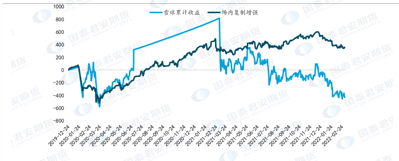
图 6：期权动态组合收益表现

如果我们降低对于雪球产品复刻的相似度，当敲入事件发生之后，并没有采用期货多头头寸替代原先的期权多空组合头寸，而是继续持有，那么在标的价格反弹时，持有的期权头寸也能获得一定的上涨收益，只是上涨幅度有限，但如果遇到敲入后标的继续下跌的行情，那么期权组合头寸能够更好地起到保护作用。与敲入线为 90%，年化票息为 15% 的雪球结构进行对比如下：