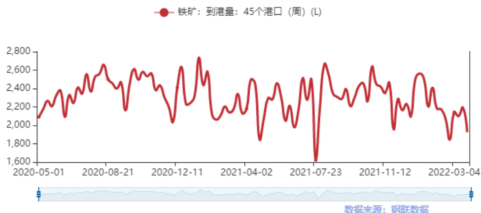
图 1 中国进口铁矿石到港量统计

从基本面看，现货端供应端澳巴发运量、到港量企稳回升，但仍处于供应低位水平，现货需求端表现继续颓势，钢厂主产地唐山、苏南及福建地区继续出现大面积焖炉、检修现象，港口铁矿石疏港量大幅度下滑，铁矿石现货高位承压，钢厂利润受终端需求疲软和原材料挺价影响继续压缩。期货端，市场普遍预测终端工地只是短期内受到了疫情的影响，从长期来看，成材的需求并没有消失，只是后延。根据上周四 MS 公布的铁水产量数据，钢厂复产后日均铁水产量为 230.27 万吨/天，较上上周上涨了 9.57 万吨/天，由此可见疫情末期铁矿石需求恢复空间非常可观，铁矿石现货价格或在阶段性回调后再度走强。