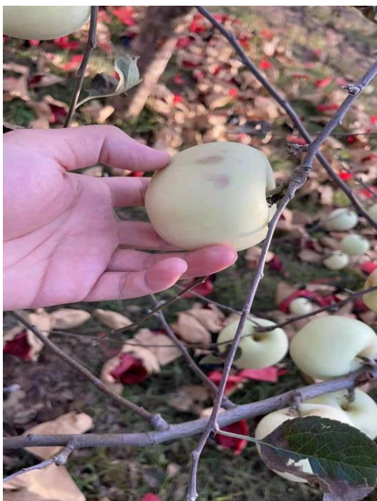
图六、早下树苹果质量情况