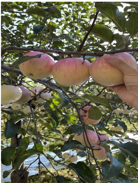
图二、整体果径较去年偏小