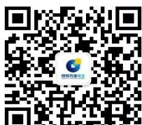
申银万国期货研究

随着我国脱贫攻坚战取得了全面胜利，人民收入水平持续提高。十四五规划建议明确提出“全面推进乡村振兴，加快农业农村现代化”。马铃薯作为国内第四大主粮，对保障国家粮食安全意义重大。特别是在甘肃省，由于自然条件的限制，小麦和水稻种植受到限制，马铃薯对当地农民增收奔小康有着特殊的使命。