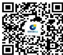
申银万国期货 宏观金融研究