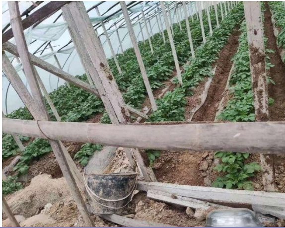
调研团参观天水早熟马铃薯种植