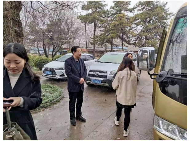
雪中与天水市农科所专家交流