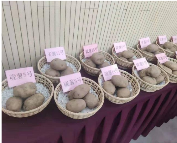
调研团参观甘肃省农科院