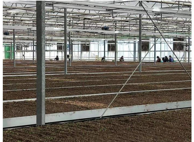
调研团参观马铃薯育种