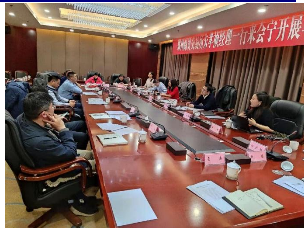
与会宁县种植大户、薯业公司交流