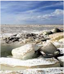
壮观1！中国内陆最大