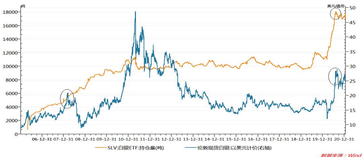
白银ETF持仓与银价走势成正比

3、拜登“绿色新政”提振光伏需求。—与黄金不同,白银不仅作为贵金属,还是重要的工业金属,超过一半的需求来自于工业,因此白银的商品属性比黄金强,在分析银价走势还需考虑其自身基本面因素。白银电阻率低、导电能力强且拥有较好的附着力与可焊性,是太阳能电池板的重要材料。此前拜登提出了 2 万亿美元的“清洁能源计划”,要在 2050 年之前实现净零碳排放,届时将推动对白银的需求上升。据研究公司 CRU 预计,到 2025 年太阳能发电量将增加近一倍;到 2030 年,该行业对白银的需求将增加到 8100 万盎司。(中性偏多)