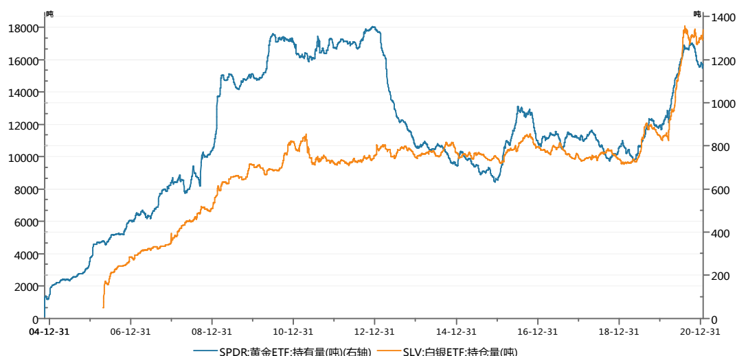
白银ETF持仓表现较黄金ETF持仓坚挺

白银 ETF 持仓日增仓创记录新高。白银 ETF 持仓是代表可以自由投资或赎回，且可以在证券市场交易的白银基金份额，其持仓变化可以反映市场投资情绪的波动，即多空力量的对比情况。若持仓增加，表明买盘增加，市场看多白银氛围上升，反之持仓下降则表明白银空头氛围上升。截至 2020 年 1 月 19 日，全球最大统计规模的白银 ETF—iShares Silver Trust (SLV) 持仓量为 17841.03 吨，较上一交易日增 621.36 吨，为 2006 年有记录以来最大单日增幅，升至去年 11 月 9 日以来新高。相比之下，同期全球最大黄金 ETF—SPDR Gold Trust 持仓量为 1174.13 吨，较上一交易日减 3.5 吨。此外截止 19 日收盘，伦敦银收 25.19 美元/盎司，日涨 1.05%；伦敦金收 1839.8 美元/盎司，日涨 0.15%，白银多头氛围确优于黄金。