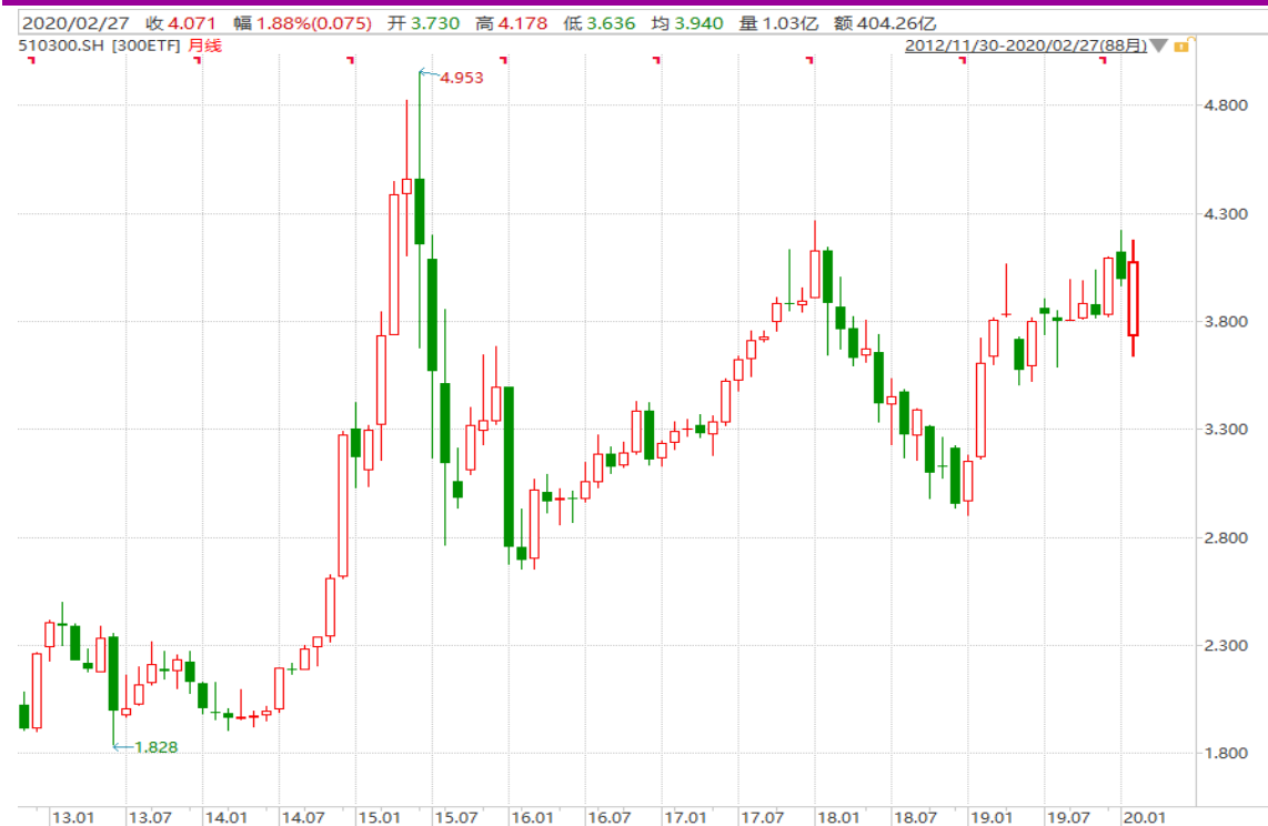
图表 12：华泰柏瑞沪深 300ETF（510300）月 K 线图

从以下的月 K 线图看，510300 本月大幅低开后又大涨，留意节前高点一线阻力区。