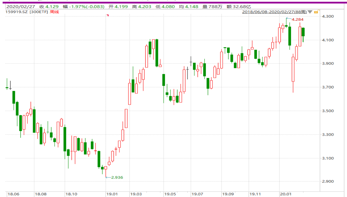
图表 19：嘉实沪深 300ETF（159919）周 K 线图

从以下的周 K 线图看，159919 连续三周收阳线后，本周震荡下行，节前高位仍有压力。