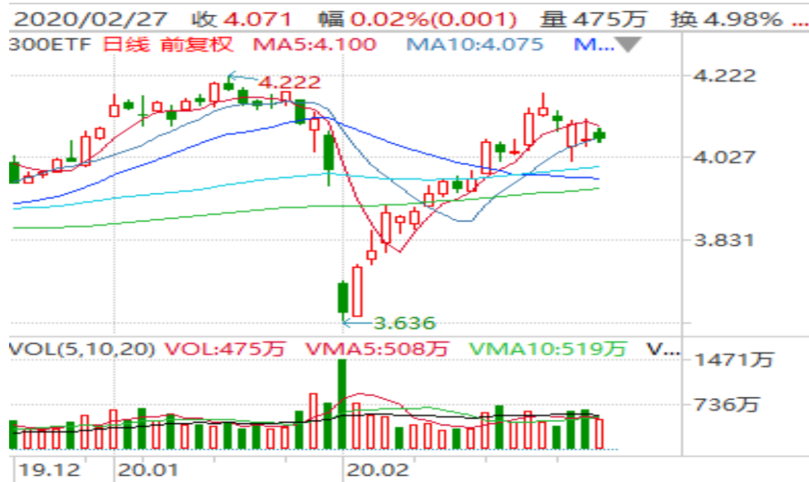
图表 10：华泰柏瑞沪深 300ETF (510300) 日 K 线图

从下面的日 K 线图来看，510300 自节后低点持续反弹回升后，近期有回落的迹象。