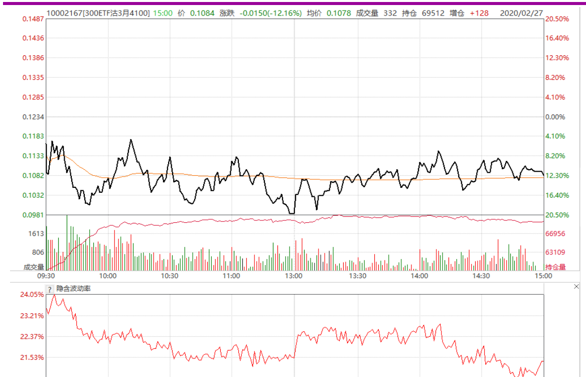
图表 15: 3 月平值认沽期权 “300ETF (510300) 沽 3 月 4100” 日内走势图及隐含波动率走势图

3 月认购期权 “300ETF (510300) 购 3 月 4100” 高开低收, 隐含波动率震荡走低。