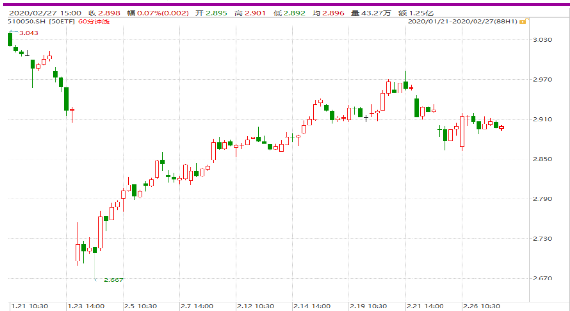
图表 1：上证 50ETF60 分钟 K 线图