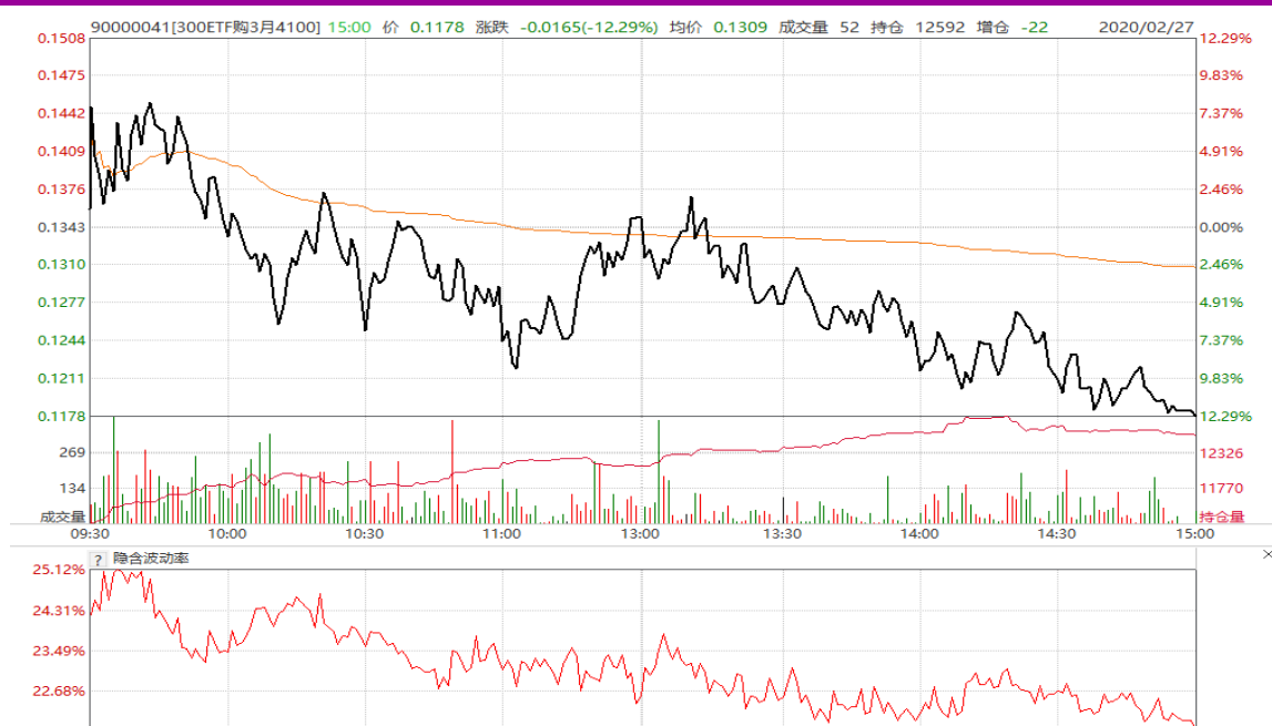
图表 22: 3 月平值认购期权“300ETF (159919) 购 3 月 4100”日内走势图及隐含波动率变化图