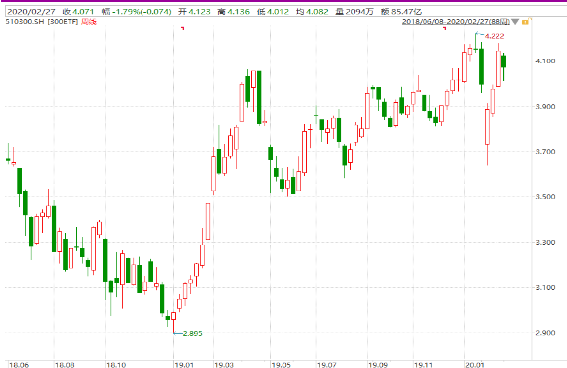
图表 11：华泰柏瑞沪深 300ETF（510300）周 K 线图