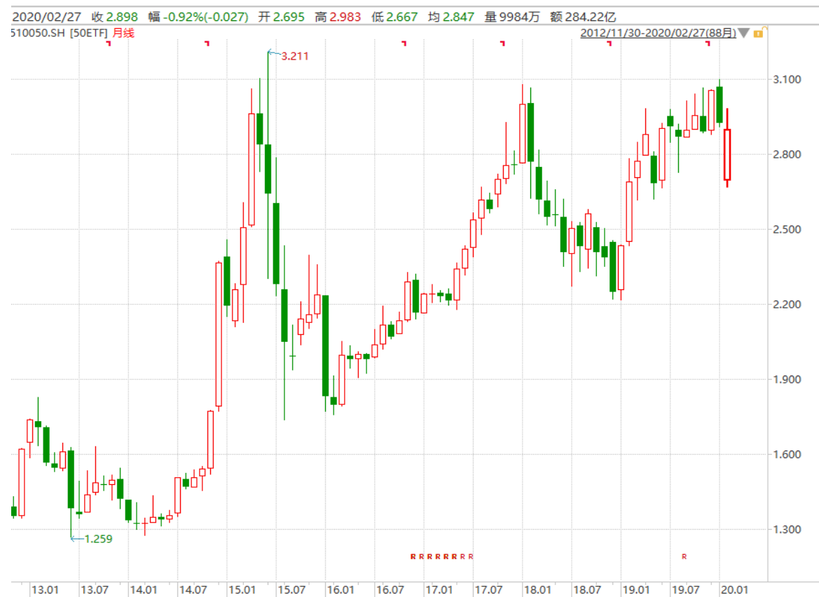
图表 4: 上证 50ETF 月 K 线图