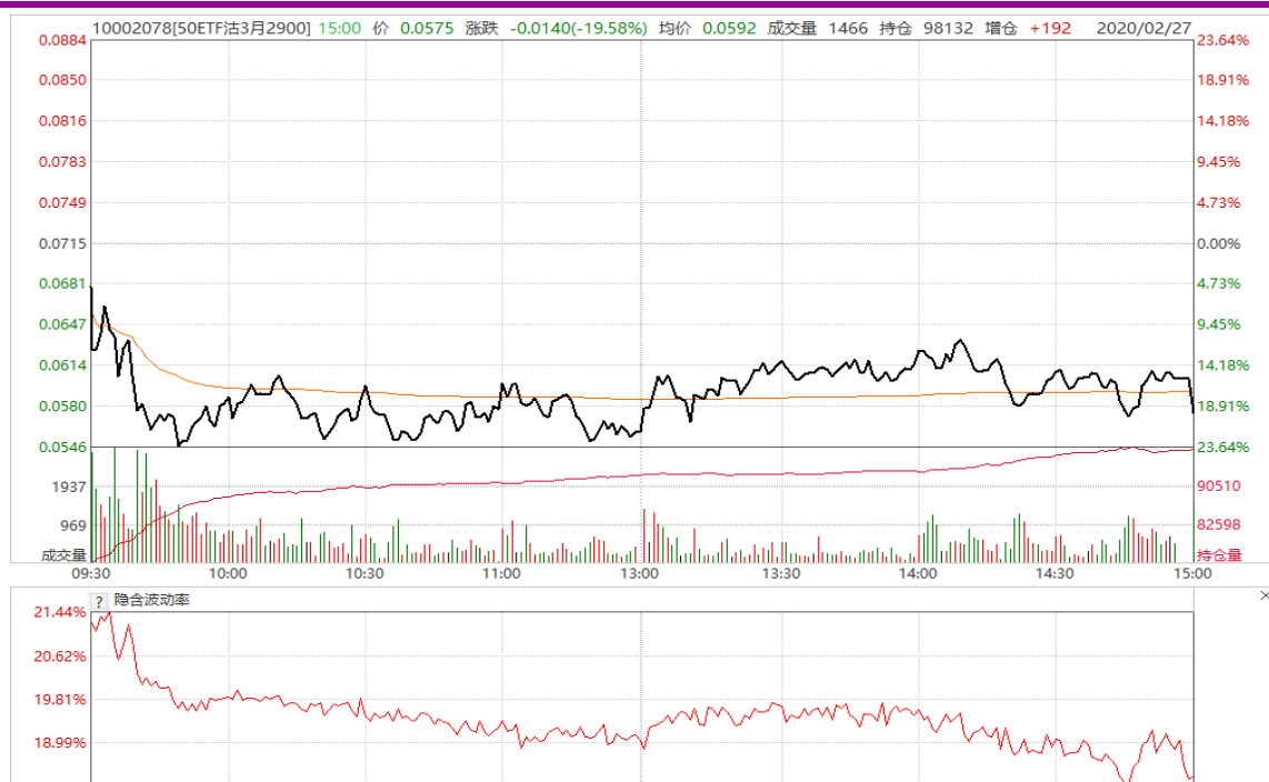
图7： 50ETF与3月平值认沽期权“50ETF 沽 3月 2900”日内走势图及隐含波动率走势图

3月平值认购期权合约“50ETF 购 3月 2900”高开低收，隐含波动率震荡收低。