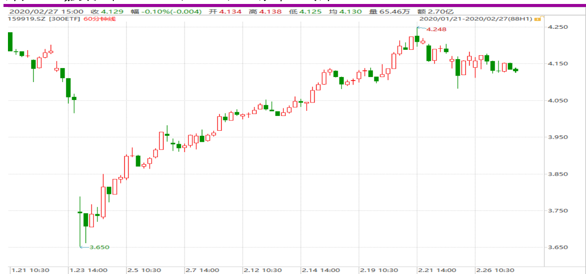
图表 17：嘉实沪深 300ETF (159919) 60 分钟 K 线图

从下面的 60 分钟图来看，159919 近期出现窄幅横盘走势，留意消息面的可能影响。