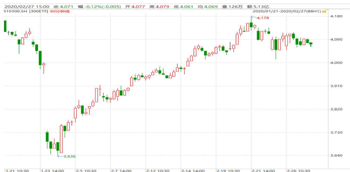
图表 9：华泰柏瑞沪深 300ETF (510300) 60 分钟 K 线图

从下面的 60 分钟图来看，510300 冲高 4.178 后出现震荡回调，短期波幅收窄。