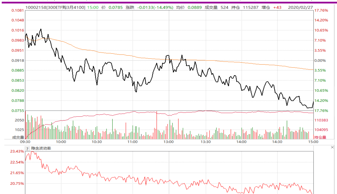
图表 14: 3 月平值认购期权 “300ETF (510300) 购 3 月 4100” 日内走势图及隐含波动率变化图