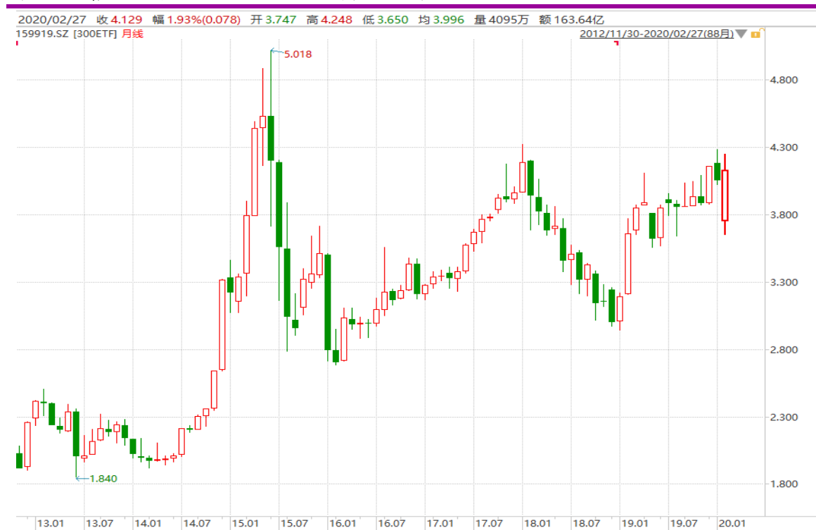
图表 20：嘉实沪深 300ETF（159919）月 K 线图

从以下的月 K 线图看，159919 本月大幅低开后又明显回升，留意消息面的影响。