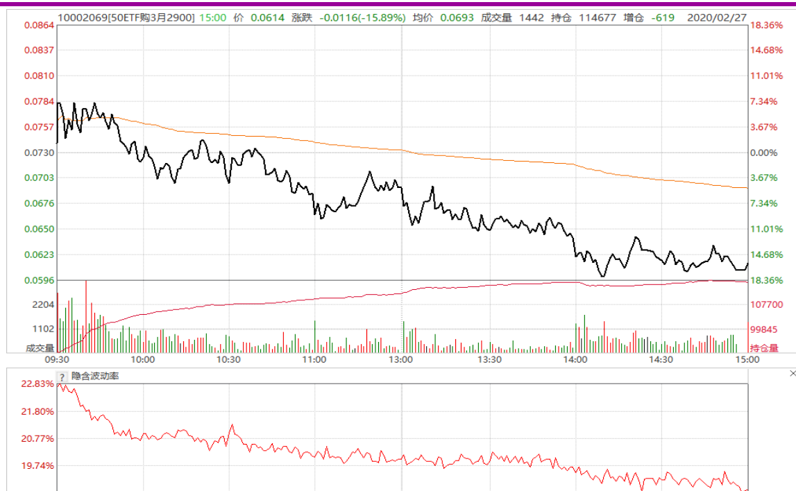
图6： 3月平值认购期权“50ETF 购 3月 2900”日内走势图及隐含波动率变化图