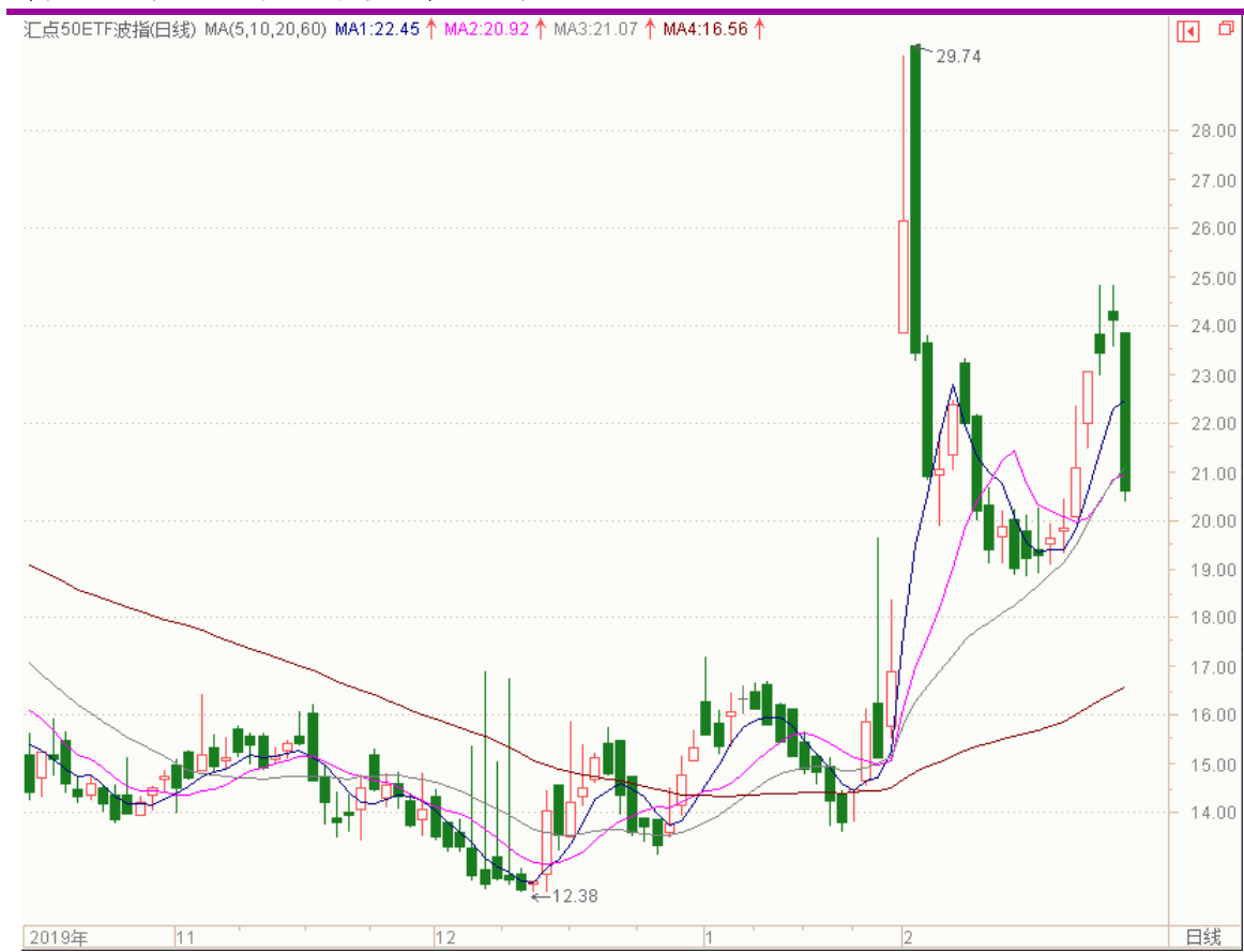
图表 8：汇点 50 加权波指变化图（日线）