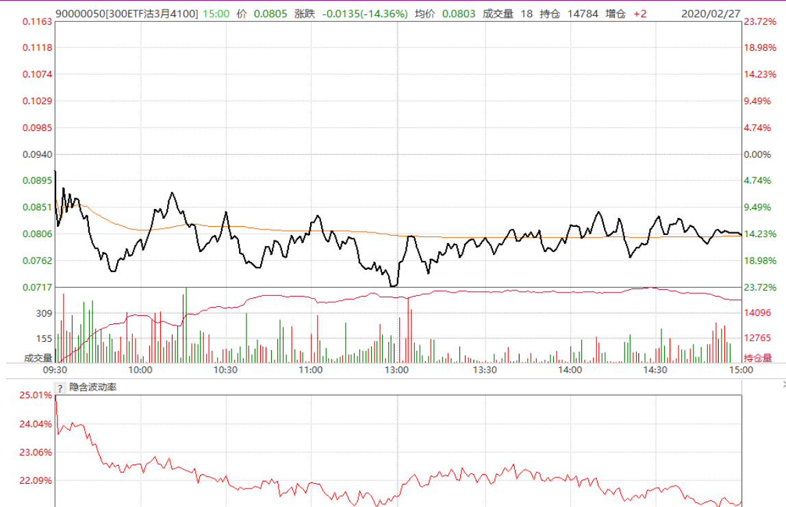
图表 23: 3 月平值认沽期权“300ETF (159919) 沽 3 月 4100”日内走势图及隐含波动率走势图

3 月认购期权合约“300ETF (159919) 购 3 月 4100”高开低收, 隐含波动率震荡收低。