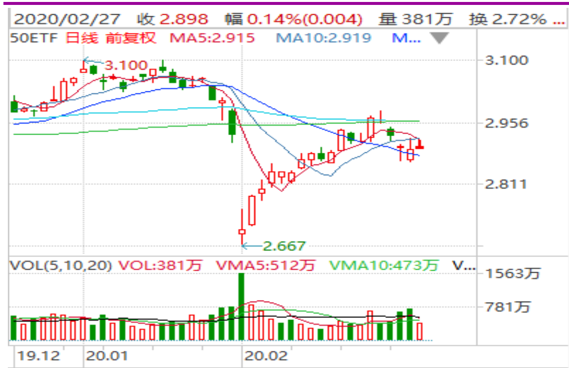
图表 2：上证 50ETF 日 K 线图