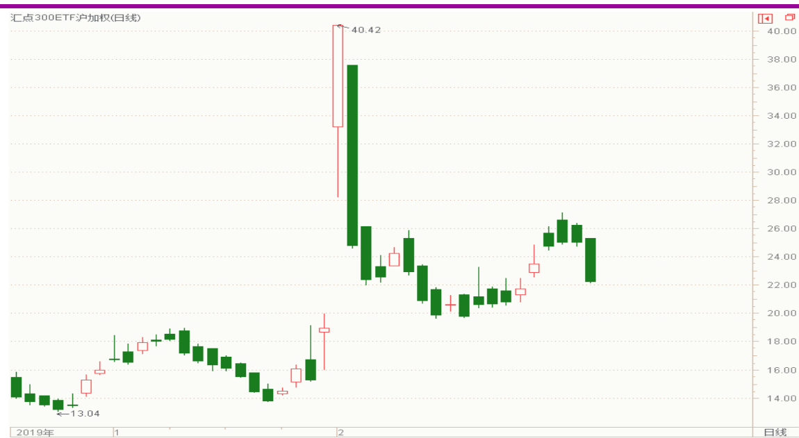
图表 16：来自汇点软件的汇点 300ETF 沪加权波指变化图（日线）

以下也提供来自汇点软件的汇点 300ETF 沪加权波指变化图（日线），可分析参考。