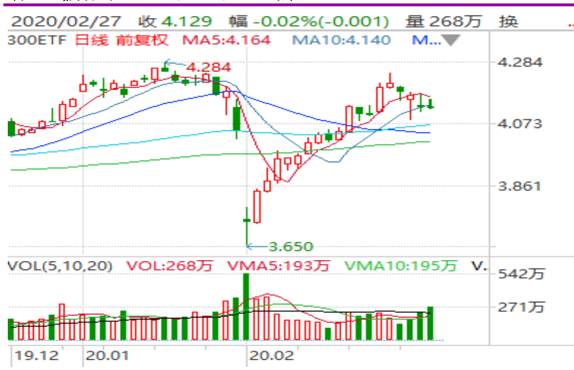
图表 18：嘉实沪深 300ETF (159919) 日 K 线图

从下面的日 K 线图来看，159919 节后大幅跳低后反弹回升，临近节前高点后震荡回落。