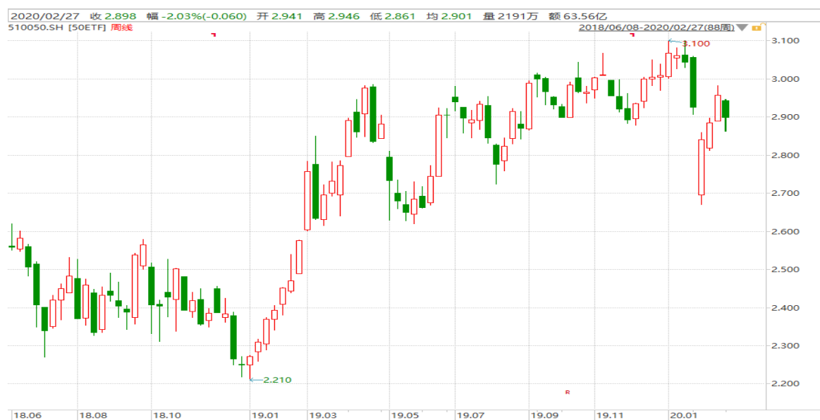
图表 3: 上证 50ETF 周 K 线图

从以下的周 K 线图看，50ETF 本周低开低走，震荡下行，留意消息面的可能影响。