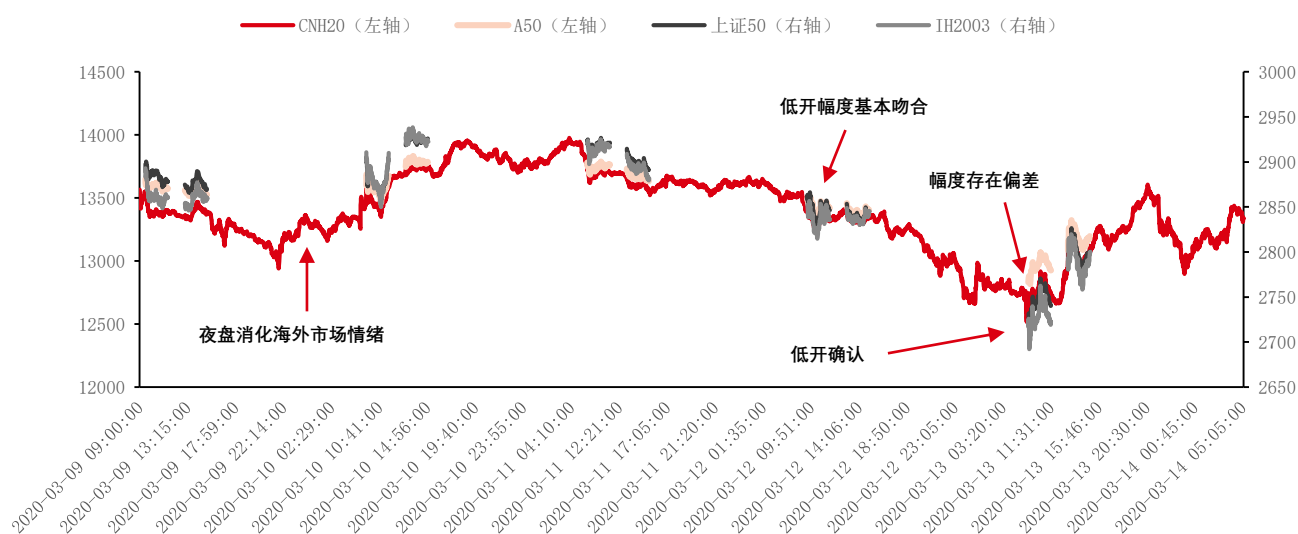
图 5：2017 年 1 月 1 日至今中证 500 指数成交比