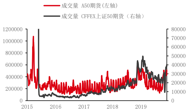
图 4：A50 股指期货以及 IH 成交量