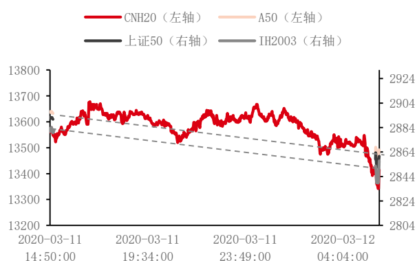
图 6：3 月 11 日~3 月 12 日 A50 及 IH 走势