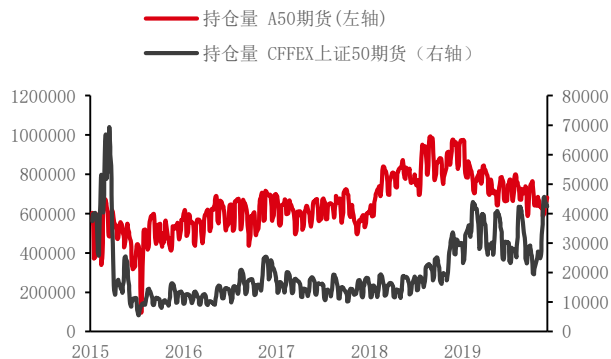
图 3：A50 股指期货以及 IH 持仓量

进一步考察 A50 股指期货以及 IH 的流动性，受到 2015 年起的股指期货受限政策影响，IH 在受限之后的流动性弱于 A50 股指期货，因此对于成分股的定价权也弱于 A50 股指期货。