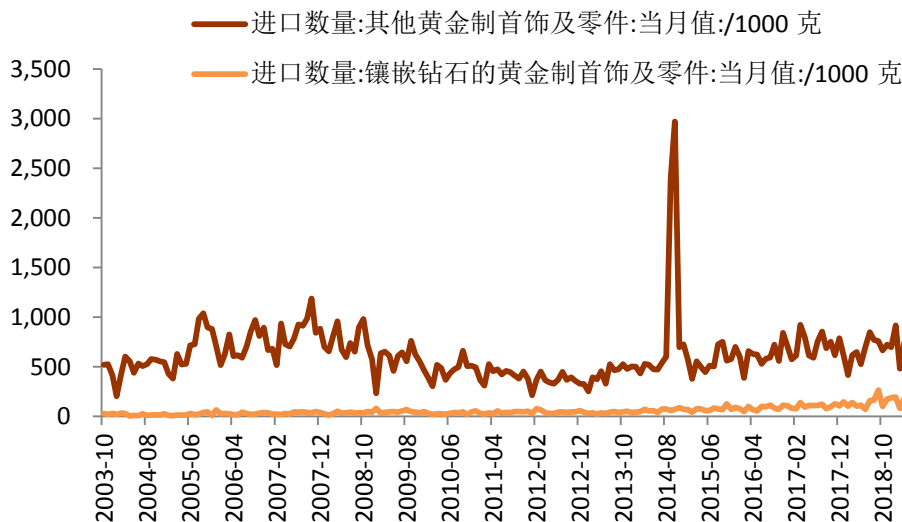
图表 2 中国进口的部分分项