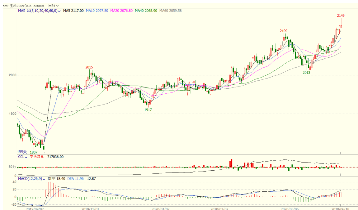
图：大商所玉米 9 月合约日线 资料来源：文华财经、方正中期期货研究院